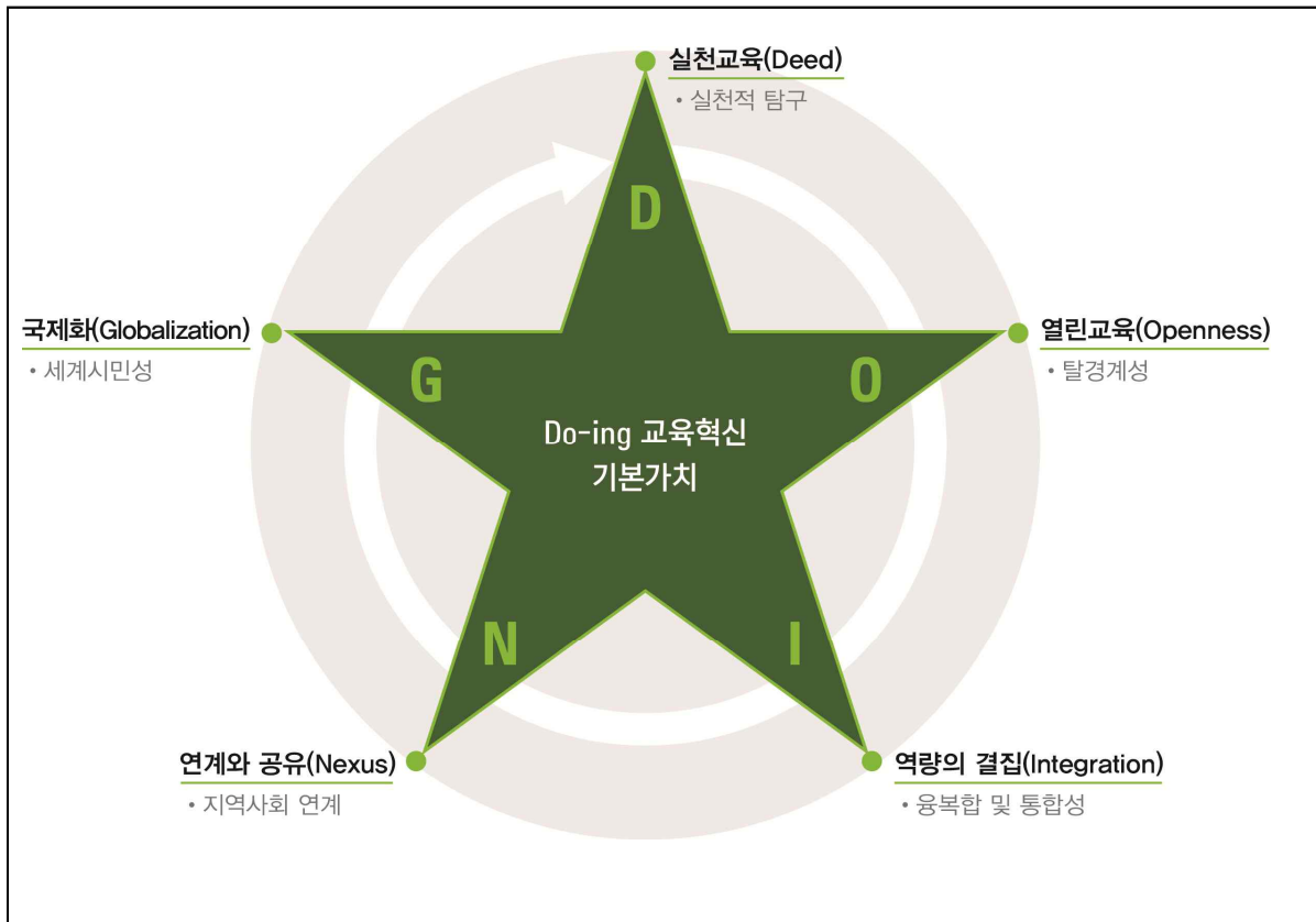
[동명대학교 Do-ing 교육혁신 기본가치]