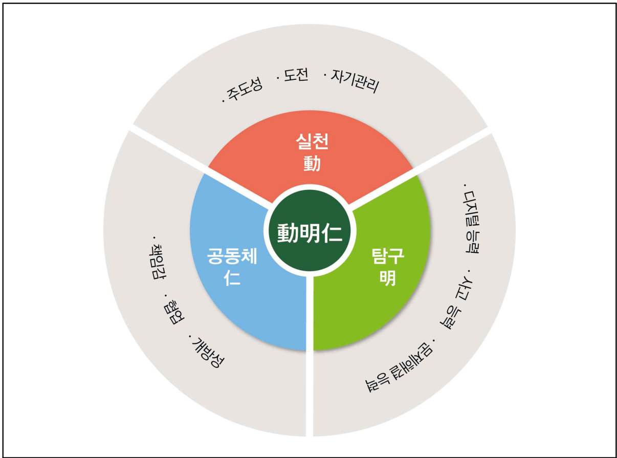
[동명인 학생역량 체계도]