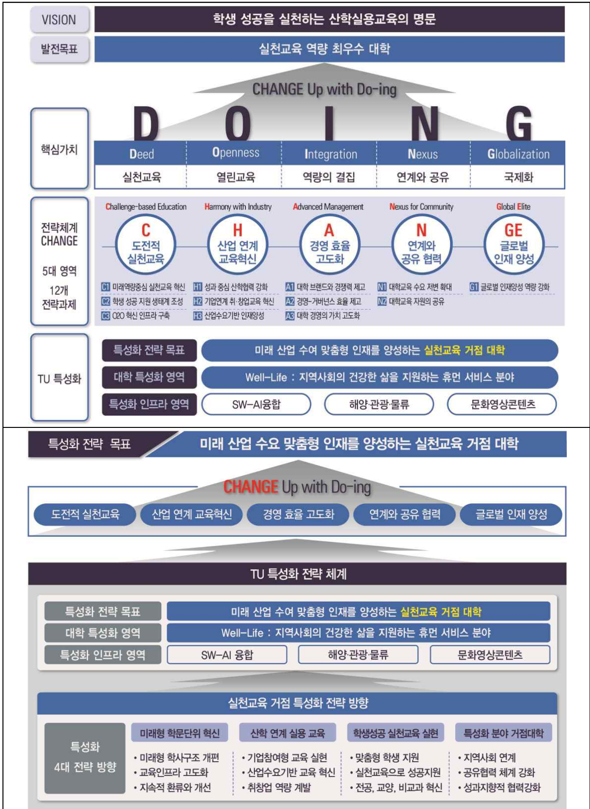
[동명대학교 TU VISION 및 TU 특성화 전략체계]